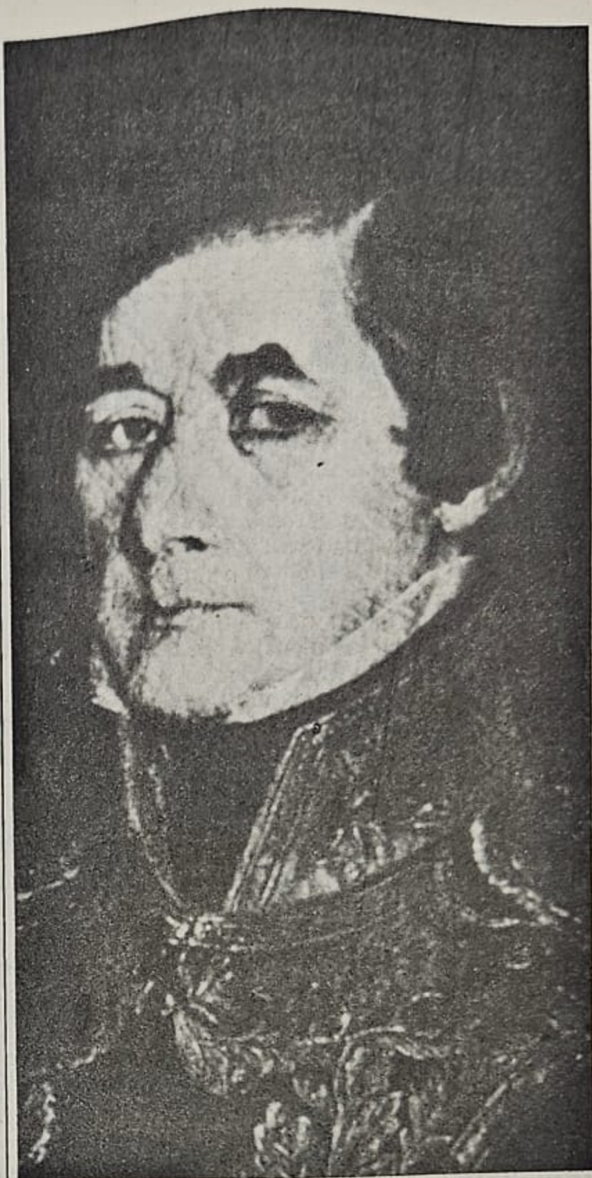
Gral. Fructuoso Rivera

Así como el tránsito de un país de corta población a uno de larga nos lleva presuntamente de una economía más abierta a otra más cerrada, el crecimiento de la población a través del tiempo